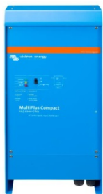
MultiPlus Compact 12/2000/80

MultiPlus poate fi folosit în la panourile fotovoltaice (PV) conectate sau nu la rețea și la alte sisteme alternative de energie. Software-ul de detectare a pierderii rețelei este disponibil.